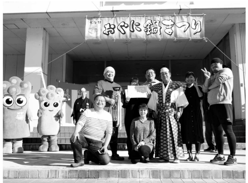
第16代おぐに鍋将軍に輝いた「トロットロ♡豚スジ鍋」 チーム名：いち藤