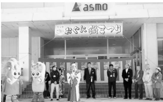
鍋奉行(仁科町長)挨拶