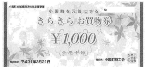
さらさらお買い物券